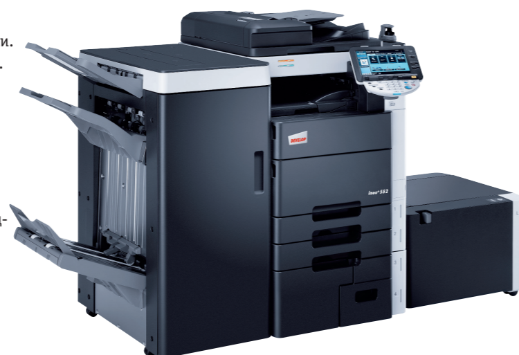
iNeo+ 552 со степлирующим финишером FS-526, устройством буклетирования SD-508, рабочим столиком WT-506, биометрическим сканером AU-102 и боковым лотком большой ёмкости LU-204.